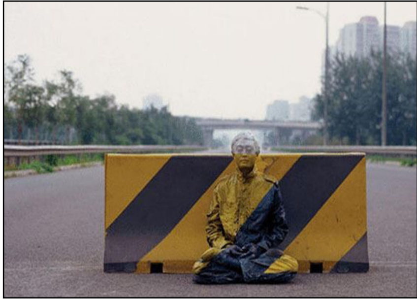
الفنون الجميلة من الأكاديمية المركزية للفنون الجميلة في بكين في عام ٢٠٠١،

وقد عرضت أعماله في المتاحف وصلات العرض في جميع أنحاء العالم.. يشتهر "ليو" بلقب "الرجل الخفي" بسبب قدرته على إخفاء نفسه باستخدام الألوان ليندمج في أي بيئة محيطية به. أما أشهر أعماله فتلك التي عرضها في كتاب "مختبئون في المدينة"، ويقول إنه بدأ هذا الأمر في عام ٢٠٠٥ ولم تكن نيته الاختفاء كما يعتقد البعض، بل الاندماج في البيئة المحيطة، وأن يصبح جزءاً منها.. واشتهر "ليو" بالتقاط مجموعة من الصور المميزة في أماكن مفتوحة في كل من "البندقية" و"نيويورك" لإثبات نفسه لمن حوله بقدرته على الاندماج مع أي مكان عام، واختار تلك المدن تحديداً نظراً لقيمته الفنية، وكونها أكبر وأضخم مدن العالم وتحتضن ثقافات عديدة.