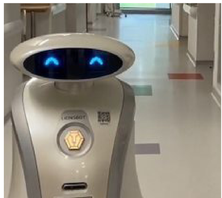
ما زاد اعتماده على المعلومات التي يجمعها من خلال الكاميرا لاتخاذ القرار .

ولا تستطيع الروبوتات باستخدام الرؤية البصرية وحدها إدراك وجود عنصر مخبأ في صندوق أو مخفي خلف كائن آخر على الرف، إذ إن الموجات الضوئية المرئية لا تمر عبر الجدران، لكن موجات الراديو يمكنها ذلك . ويستخدم RF Grasp كلاً من الكاميرا وقارئ الترددات اللاسلكية RF للعثور على الأشياء المميزة بعلامات والتقاطها، حتى عندما تكون محجوبة تماماً عن رؤية الكاميرا . وطالما أن العنصر يتضمن علامة الترددات اللاسلكية RF، فيمكن للروبوت العثور عليه، حتى لو كان مخفياً خلف أشياء، مثل ورق التغليف . وعلى عكس مشروعات الروبوتات الجامعية النموذجية، فإن هناك حالة استخدام واضحة لهذا الاختراع أيضاً، ويرى الفريق أن RF Grasp يساعد شركات، مثل أمازون، على زيادة أتمتة مستودعاتها وتبسيطها . ويتمثل الجانب الأكثر تحدياً في تطوير RF Grasp هو دمج الرؤية البصرية والترددات اللاسلكية في عملية صنع القرار، ويقارن الفريق النظام الحالي بكيفية تفاعل مع صوت بعيد عن طريق إدارة رأسك لتحديد مصدره بدقة . ويستخدم RF Grasp قارئ الترددات