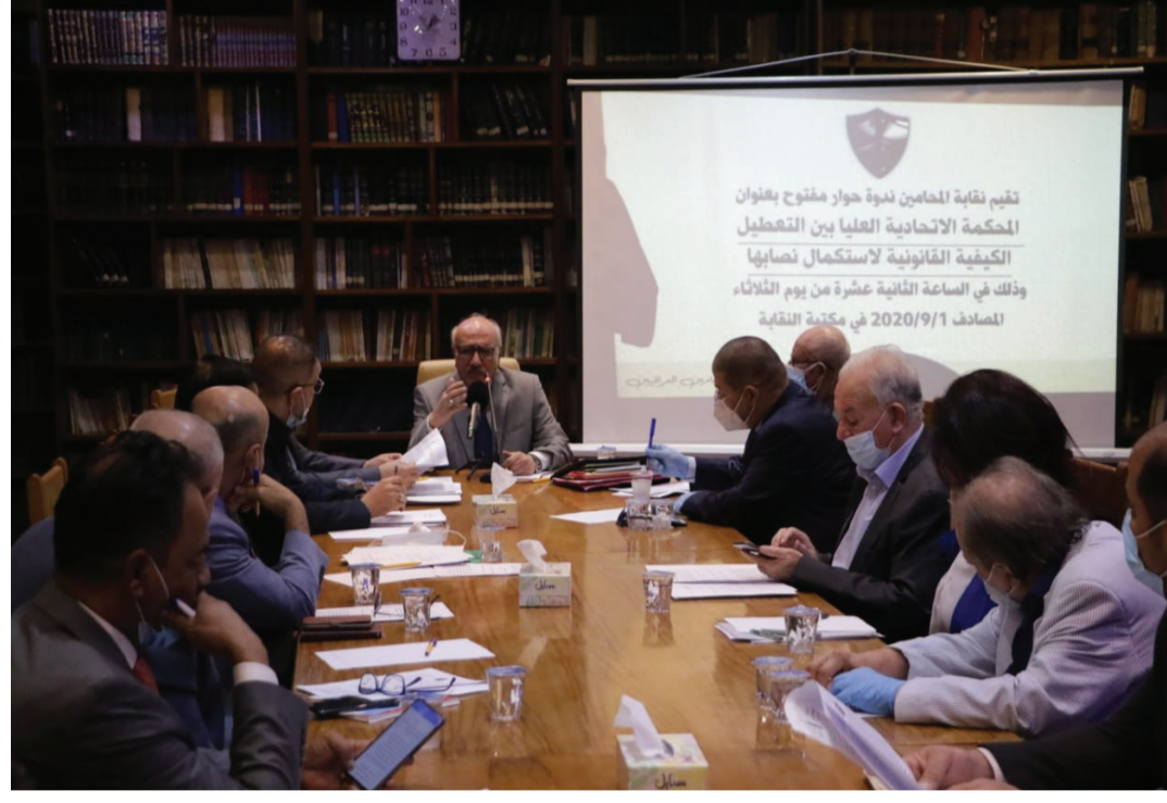
أعضائها يعد من أهم الخطوات لإجراء الانتخابات المبكرة، الاختصاص الوحيد في المصادقة التي يجب إتمامها استعدادا كون المحكمة الاتحادية صاحبة على نتائج الانتخابات.

ينبغي ايها الإخوة والأخوات ونحن نخيي ذكرى يوم المحامي العراقي المصادف لتأسيس نقابتهم في ٢٣/٨/١٩٣٣ أن نستلهم دائما مواقفنا في الوقت الحاضر سواء أكان نقابة أو محامين من ذلك التراث الوطني الثر لننهض مجددا بدور النقابة الوطني بما يلي ما هو معقول علينا جميعا من قبل أبناء شعبنا العراقي وهو يعانين من العديد من الأزمات والمحن التاريخية، وبما يعبر عن الوقوف الى جانبه للدفاع عن حقوقه ونصرتة، وختاما أكرر التهنيئة بهذه المناسبة الجليلة لكل محام وكل محامية، ومريدا من الوحدة والنضام والعمل المشترك من أجل الرقي بالمحاماة والمحامين خدمة لشعبنا العراقي المحامي، ومنظومة العدالة في بلدنا العزيز.