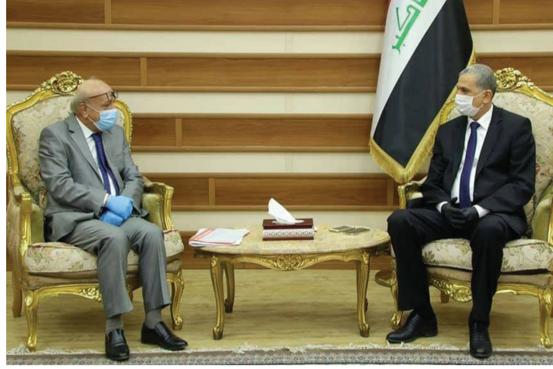
في ظروف فرض حظر التجوال، في الوصول إلى المحاكم ومراكز الشرطة، خصوصاً بالنسبة لقضايا التحقيق والقضايا الجزائية التي تستوجب سرعة إكمال الإجراءات.