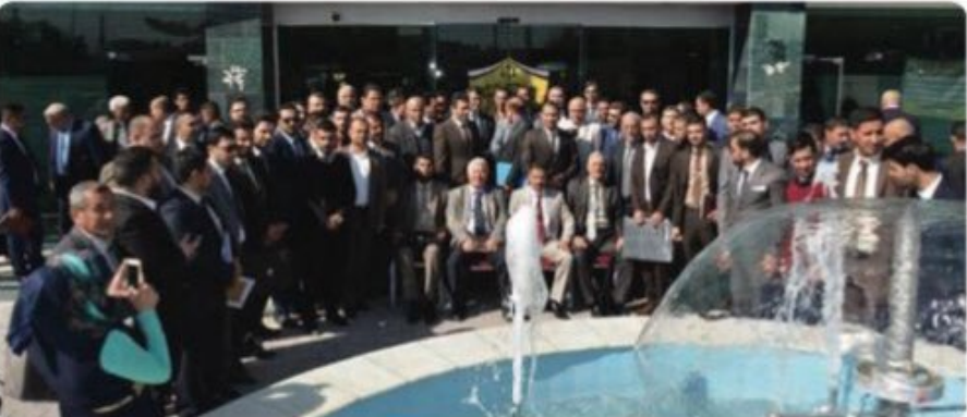
واقع المحامي اليوم أصبح جيدا وارتقى بمستوى الطموح وأخذ دوره الحقيقي في المجتمع