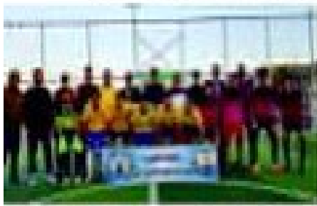
مباراة من بطولة تنشيط كرة القدم التي تقيمها نقابة المحامين في مدينة ذي قار.

تحت إشراف نقيب المحامين في مدينة ذي قار، تقيم نقابة المحامين بطولة تنشيط كرة القدم، بمشاركة عدد من المحامين واللاعبين. وتهدف البطولة إلى تعزيز الروح الرياضية وتنشيط اللاعبين في مجال كرة القدم.